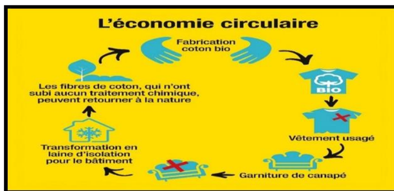
Figure 1 : L'économie circulaire expliquée à travers l'exemple du coton 5